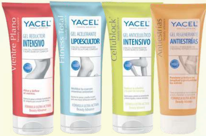
TRATAMIENTOS ANTICELULÍTICOS Y REDUCTORES YACEL