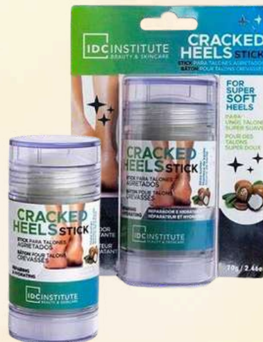
STICK TALONES AGRIETADOS