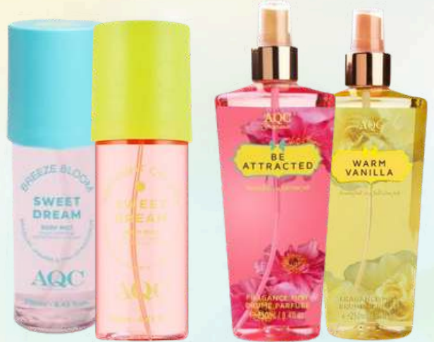
BRUMA CORPORAL PERFUMADA