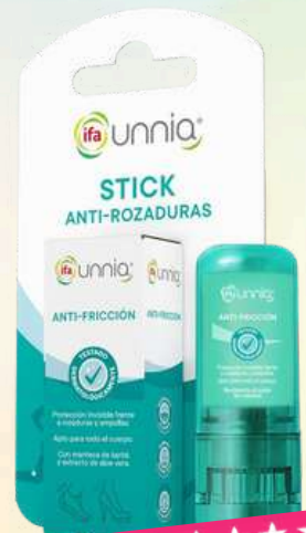
STICK ANTI- ROZADURAS