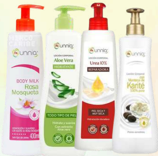
LECHE CORPORAL HIDRATANTE