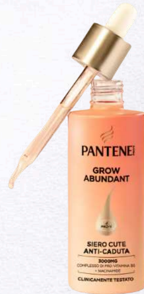
Grow Abundant Sérum Anticaída