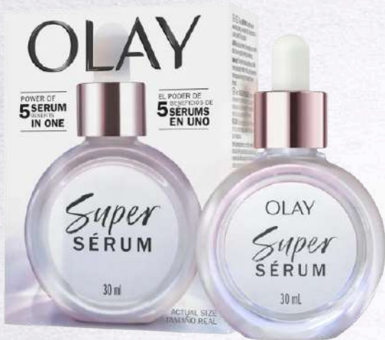
Super Serum Facial Hidratante Vitamina C y Niacinamida