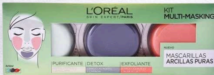
Kit con 3 mascarillas faciales de arcillas puras